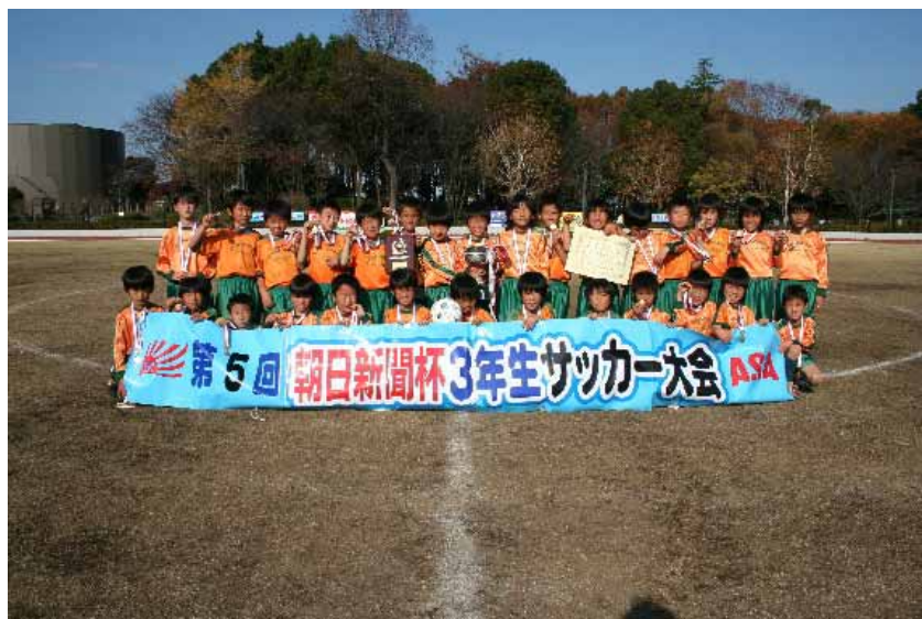
優勝 NPO FC パーシモン